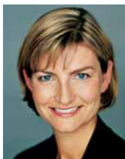
Ulla Tørnæs Udviklingsminister