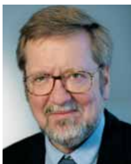
Per Stig Møller Udenrigsminister

Latinamerika-strategien er et levende dokument, og regeringen vil løbende vurdere gennemførelsen af strategien samt overveje nye tiltag. Regeringen vil indgå i en dialog med danske interessenter i erhvervslivet, erhvervsorganisationerne, forskningsverdenen og NGO-miljøet med henblik på at drøfte nye initiativer, som kan styrke dansk interessevaretagelse og tilstedeværelse i Latinamerika.